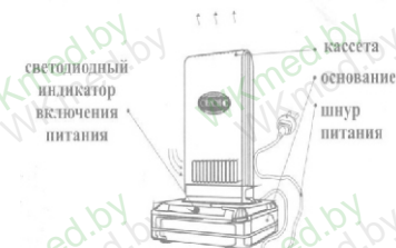
Рис.1. Общий вид воздухоочистителя

Прибор состоит из 2 частей: основания, в котором расположен электронный блок питания, и легкостёмной кассеты. Внутри кассеты размещены ионизирующий узел и осадительные электроды, образующие очистную камеру.